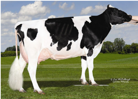
OCD PLANET DANICA FIFTH DAM